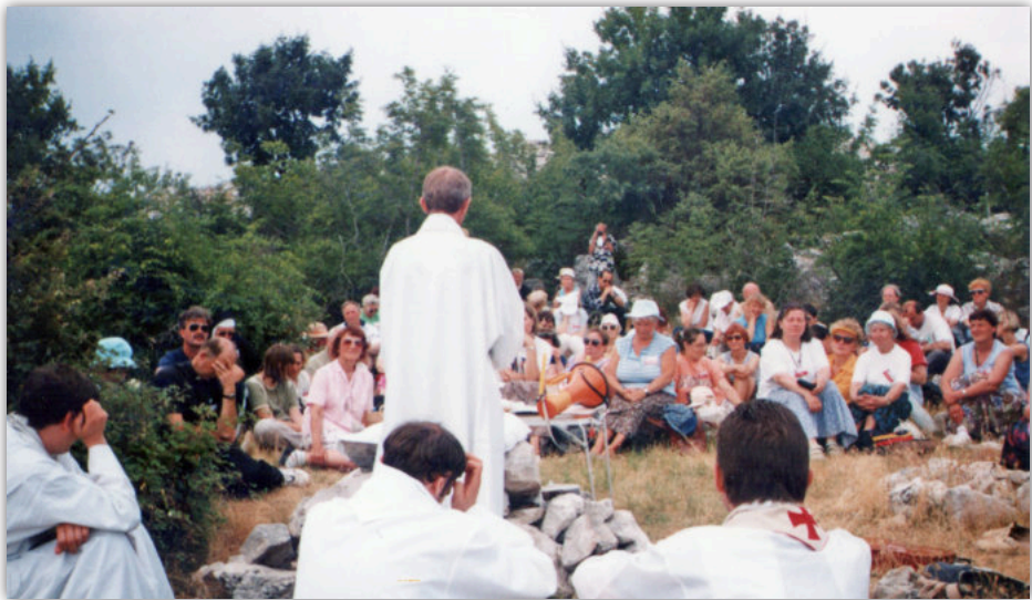
Ritiro sulla strada per Medjugorje.