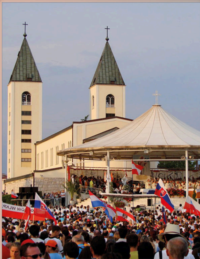
Medjugorie, Chiesa di San Giacomo