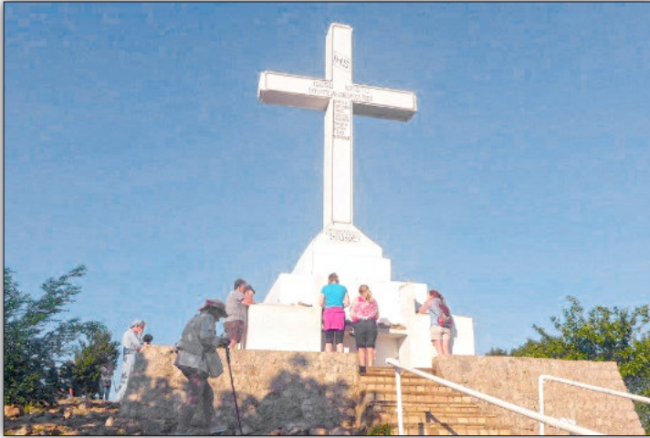
Monte della Croce a Medjugorje