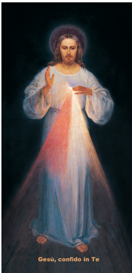
Gesù, confido in Te

Uno dei cappellani del carcere mi ha suggerito la necessità di stampare immagini di Gesù Misericordioso non solo con informazioni sulle promesse di grazie, ma anche con il testo completo della Coroncina della Divina Misericordia: Padre Nostro..., Ave Maria..., Credo in Dio..., sostenendo che questo è molto necessario, non solo per i detenuti.