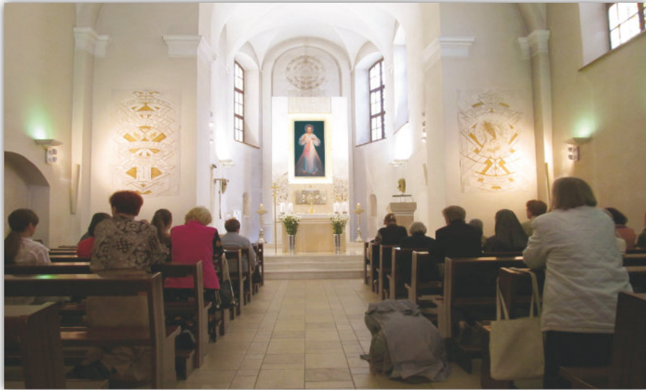
Adorazione perpetua presso il Santuario della Divina Misericordia, Vilnius, via Dominikon 12, dove si trova la prima immagine di Gesù Misericordioso.

Attraverso questa immagine concederò molte grazie... e attraverso questa ogni anima possa accedervi.