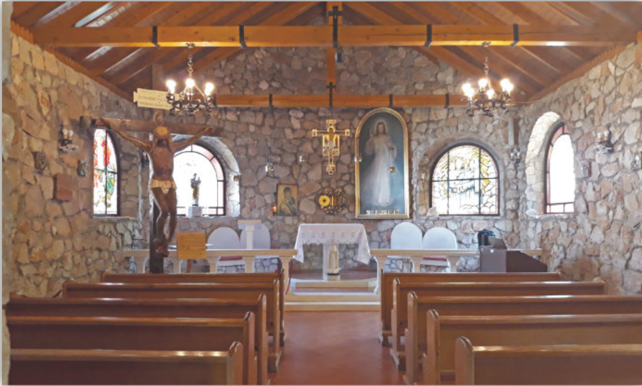
Cappella nell'"Oasi della Pace"

Sentendomi sollevata e gioiosa, dopo due giorni sono andata alla Croce Blu per ringraziare Dio per tutto quello che era successo. Essendo sola, ho potuto analizzare con calma l'intero corso degli eventi emozionanti del dipinto. Ero felice della conclusione positiva del caso, senza rendermi conto che era solo l'inizio del mio difficile ministero a lungo termine.