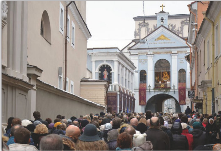
Immagine di Gesù Misericordioso in mostra a Porta dell'Aurora [Vilnius, Lituania] durante la Festa della Divina Misericordia. Vista contemporanea.