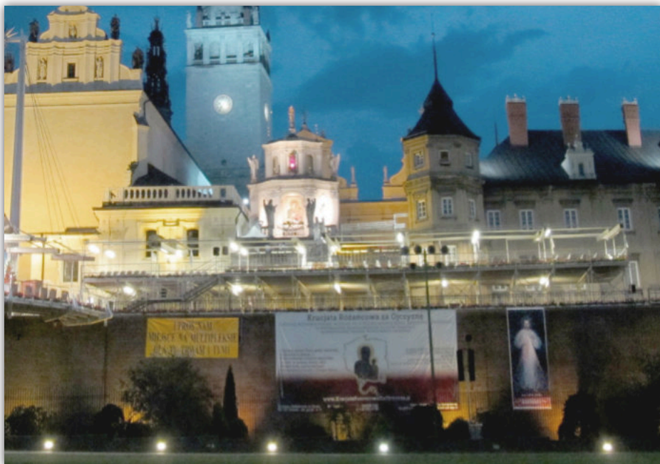
L'immagine di Gesù Misericordioso sul muro di Jasna Góra (Polonia)

Al termine della Novena nella Festa della Divina Misericordia del 2000, "Radio Maryja" ha trasmesso ufficialmente la cerimonia. Padre Piotr mi ha anche aiutato nel diffondere successivamente le immagini di Gesù Misericordioso durante gli incontri della "Famiglia Radio Maryja" a Jasna Góra e nel posizionare una copia grande della prima immagine con l'immagine di Gesù Misericordioso sul muro del santuario di Jasna Góra per queste celebrazioni.